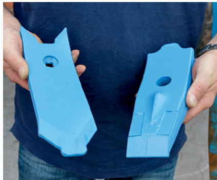
Der Träger des Hartmetallschars (rechts) ist wesentlich massiver.

Ebenso ernüchternd ist es, wenn der aufgebrauchte Verschleißschutz vorzeitig abbricht, weil das Trägermaterial darunter vorzeitig ausgewaschen ist. Das Hartmetall hätte in diesem Moment noch lange genutzt werden können.