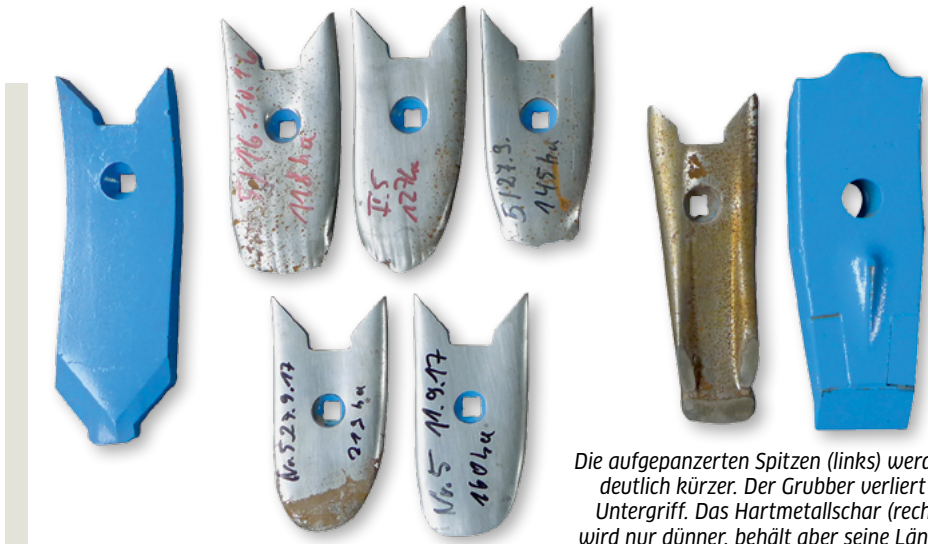
Die aufgepanzerten Spitzen (links) werden deutlich kürzer. Der Grubber verliert an Untergriff. Das Hartmetallschar (rechts) wird nur dünner, behält aber seine Länge.

Gepanzerte Schare und mit Hartmetall bestückte Schare haben wir verglichen, um die Wirtschaftlichkeit einschätzen zu können. Beide Varianten stammen aus dem Hause Lemken. Die Hartmetallversion wurde gemeinsam mit der Firma Betek entwickelt, die als Spezialist für Hartmetall in industrieller Anwendung bekannt ist.